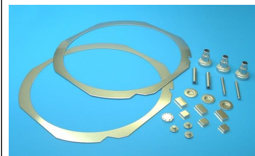
【固溶化熱処理・溶体化処理】